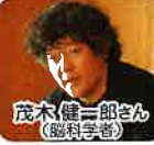
茂木 健一郎さん (脳科学者)