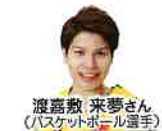
渡嘉敷 来夢さん (バスケットボール選手)