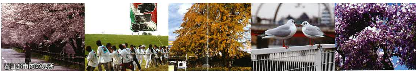
春日部市内の見所