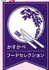
かすかべ フードセレクション

プレミアム感のある食品として、全国に向けて広く発信し、販路を拡大することで、市内の地域産業の活性化と地域イメージの向上を図っています。