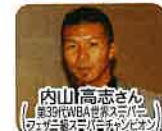
内山高志さん (第39回WBA世界スラッパ チャンピオン)