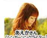
あえがさん (シンガーソングライター)