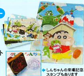
しんちゃんの来場記念スタンプもあります