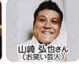
山崎 弘也さん (お笑い芸人)