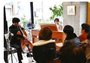
まちかどコンサート