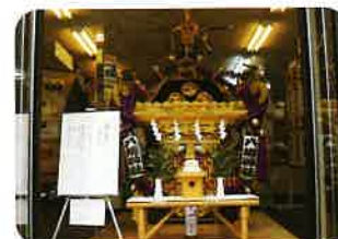
夏まつり 御輿展示