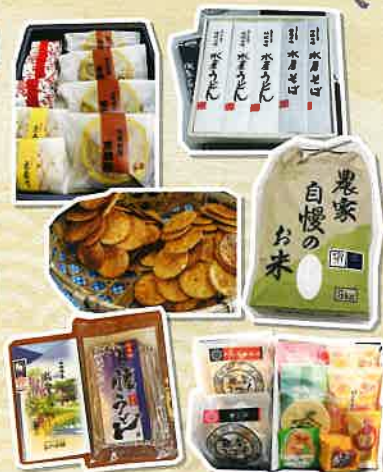
※埼玉六宿の特産品はお選びいただけません。